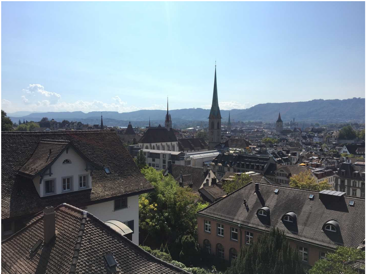
ETH Zurich メインビルディングからの眺め

な強度（YouTube でリスニング向上・表現の学習，洋書でリーディング速度向上，英会話でスピーキング力強化など）で学ぶといいと思う。