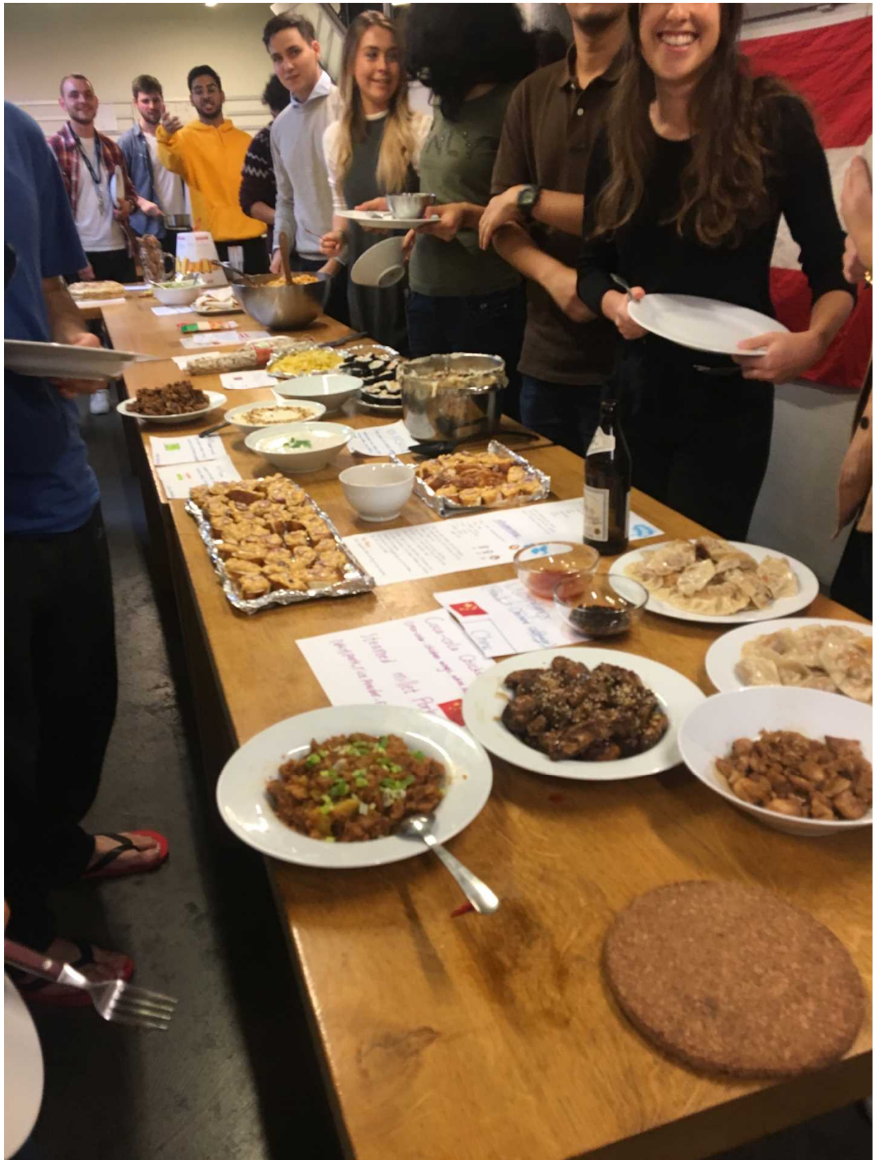
寮で行われた International Dinner Party の様子