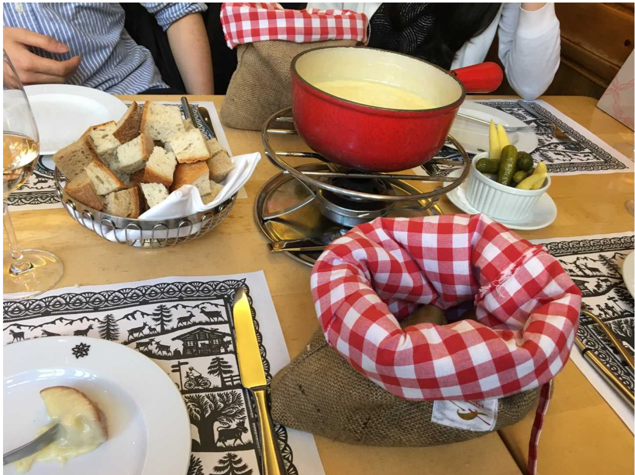
数少ないスイスでの外食．伝統料理のチーズフォンデュ．

食事：スイスでの外食は高額なので友人と会って利用するのみだった．留学期間中，レストランの利用は1回，ファストフード店の利用は3-4回のみであった．大学内に食堂があるが，現地到着後と帰国前の計6-7回しか利用しなかった．そのほかは寮で自炊し，毎週1回ドイツの南端の街にあるハイパーマーケットで1週間分の食料（主に肉や魚，野菜）を調達していた．飲料水やパン，ヨーグルトなどはスイスの中でも安いスーパーで購入した．