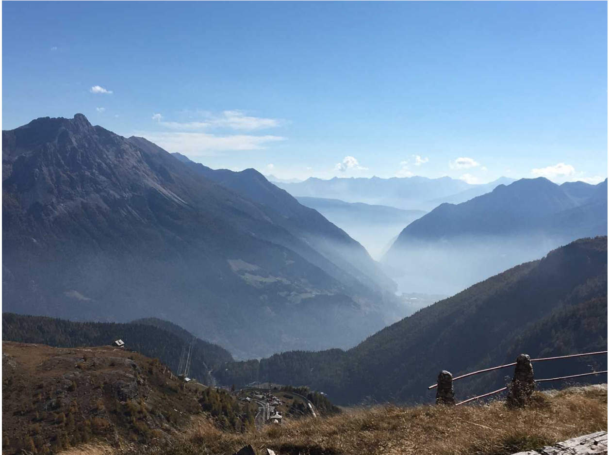
冬が来る前に現地で知り合った人と5人でハイキング

tandem：これは UZH のプログラムであるが，ETH の学生も利用可能．チューリッヒはドイツ語圏なので，自分は日本語を教える代わりにドイツ語を教えてもらうパートナーを見つけて，週1回直接会って行っていた．両者とも未知の言語を学ぶだけあって，教材は初学者用のかっちりしたものを使って真面目に行っていたが，ある程度知っている言語であれば，YouTube で文化比較の動画を見たり，特定の表現を使うような例文を作って練習したり，というより多様な使い方も可能．