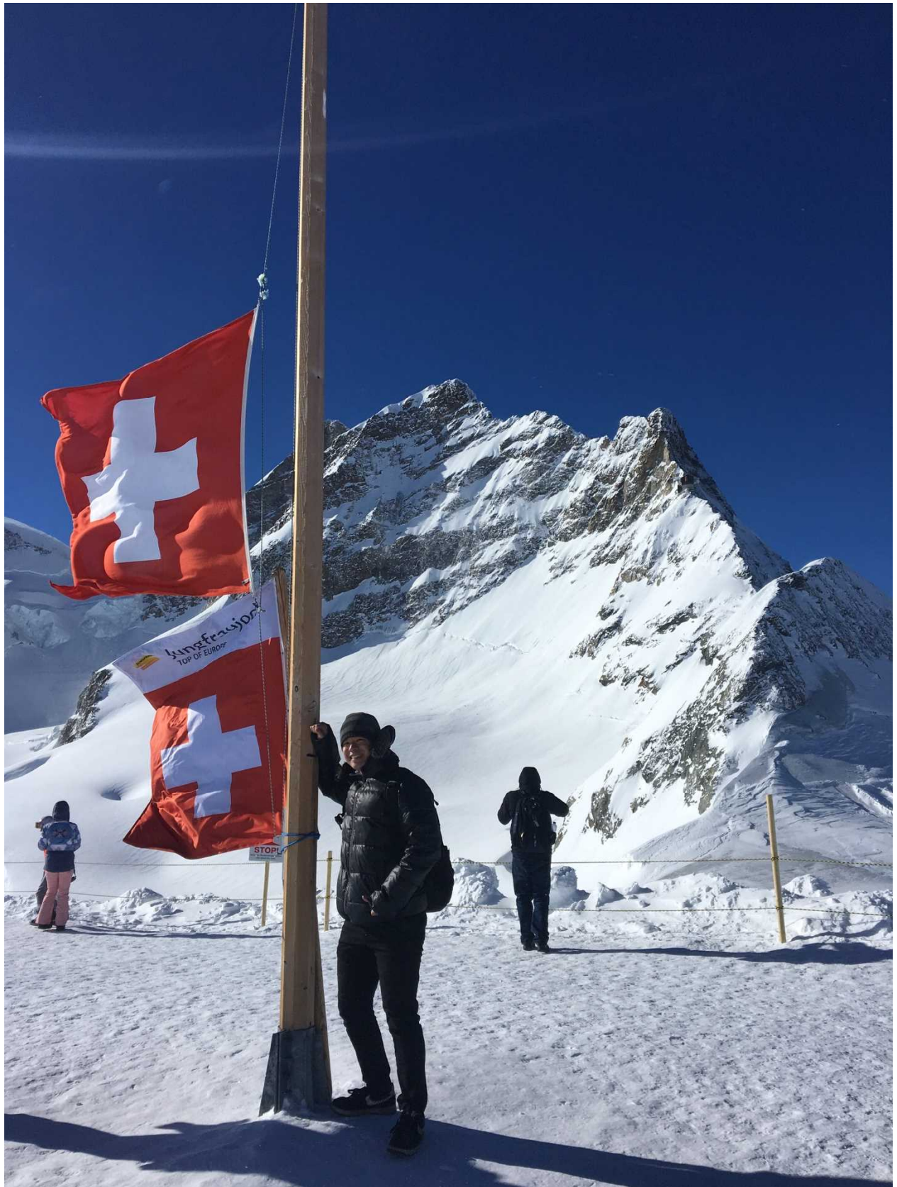
ユングフラウ (Top of Europe) . ありがとうスイス!