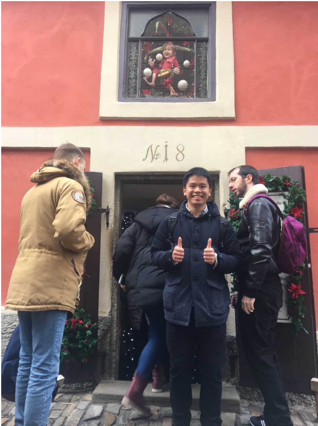
チェコにて 留学を振り返って～留学に至るまでの決意，意義