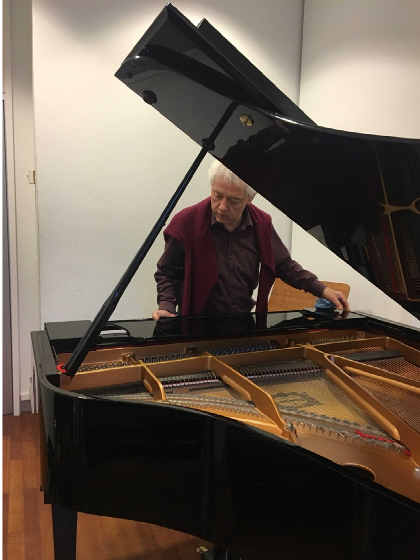
ピアノ練習ルーム。この時は偶然調律師がいた！