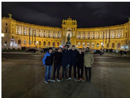
ウィーンでの写真

TUMi という international students に向けた活動があるので、Wein(ウィーン)に2泊3日で行く企画もあったので参加しました。